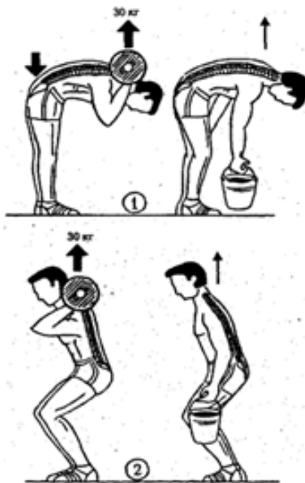
Рис. 1. Воздействие на межпозвоночные диски груза, поднимаемого различными способами (с использованием материалов Р. Хедмана): 1 - неправильно; 2 – правильно

Каждый вид спорта способствует совершенствованию определенных физических и психических качеств. И если эти качества, умения и навыки, осваиваемые в ходе спортивного совершенствования, совпадают с профессиональными, то такие виды спорта считаются профессионально-прикладными. Элементы состязательности, сопряженные с повышенными физическими и психическими нагрузками, позволяют широко использовать спорт в процессе совершенствования профессионально-прикладной физической подготовки студентов. Однако занятия прикладными видами спорта не единственный метод для решения всего комплекса вопросов ППФП студентов из-за недостаточной избирательности и неполного охвата задач этой подготовки будущего специалиста к любой конкретной профессии.