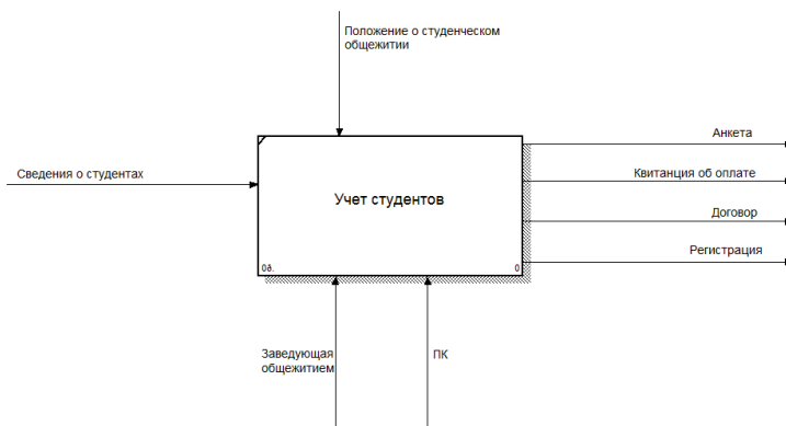
Рисунок 1. Контекстная диаграмма

Изображение контекстной диаграммы, реализованной в ERWin Process Modeler r7, представлено на рисунке 1.