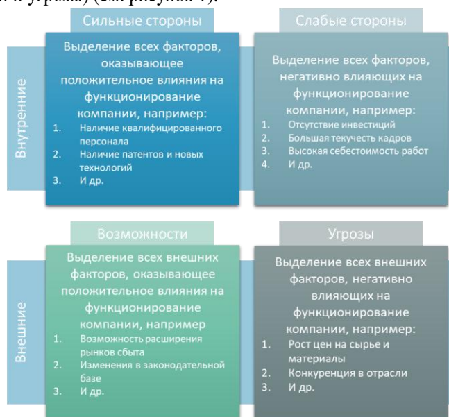
Рис. 1. SWOT-анализ

SWOT-анализ предполагает характеристику внутренней и внешней среды компании по 4-м аспектам (сильные стороны, слабые стороны, возможности и угрозы) (см. рисунок 1).