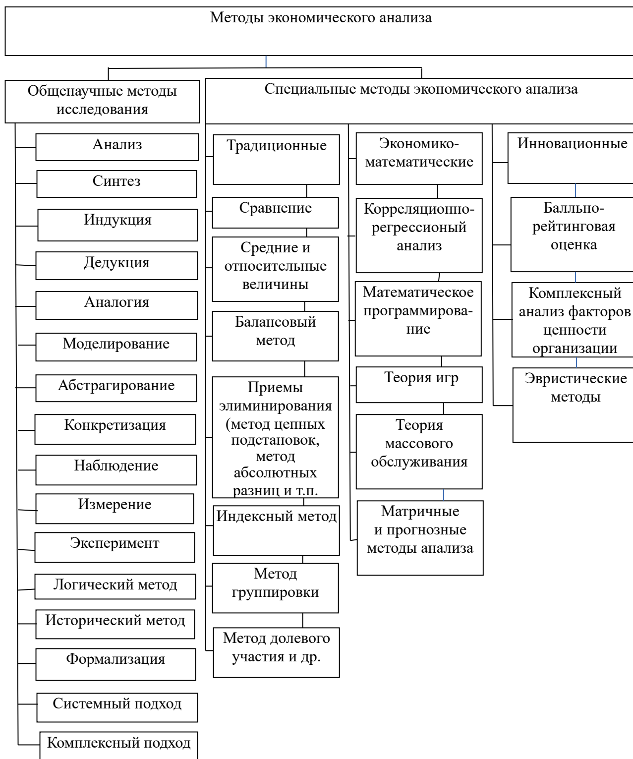
Рис. 3. Классификация методов исследования в экономическом анализе