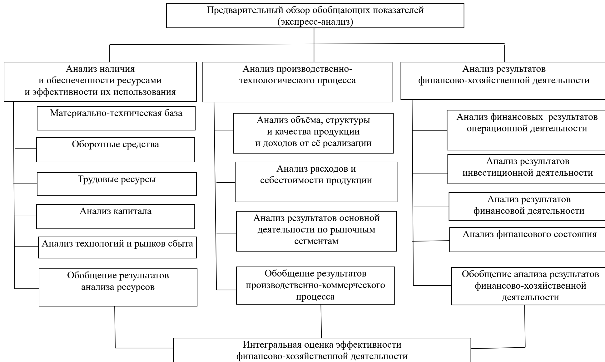
Рис. 2. Модель комплексного анализа финансово-хозяйственной деятельности