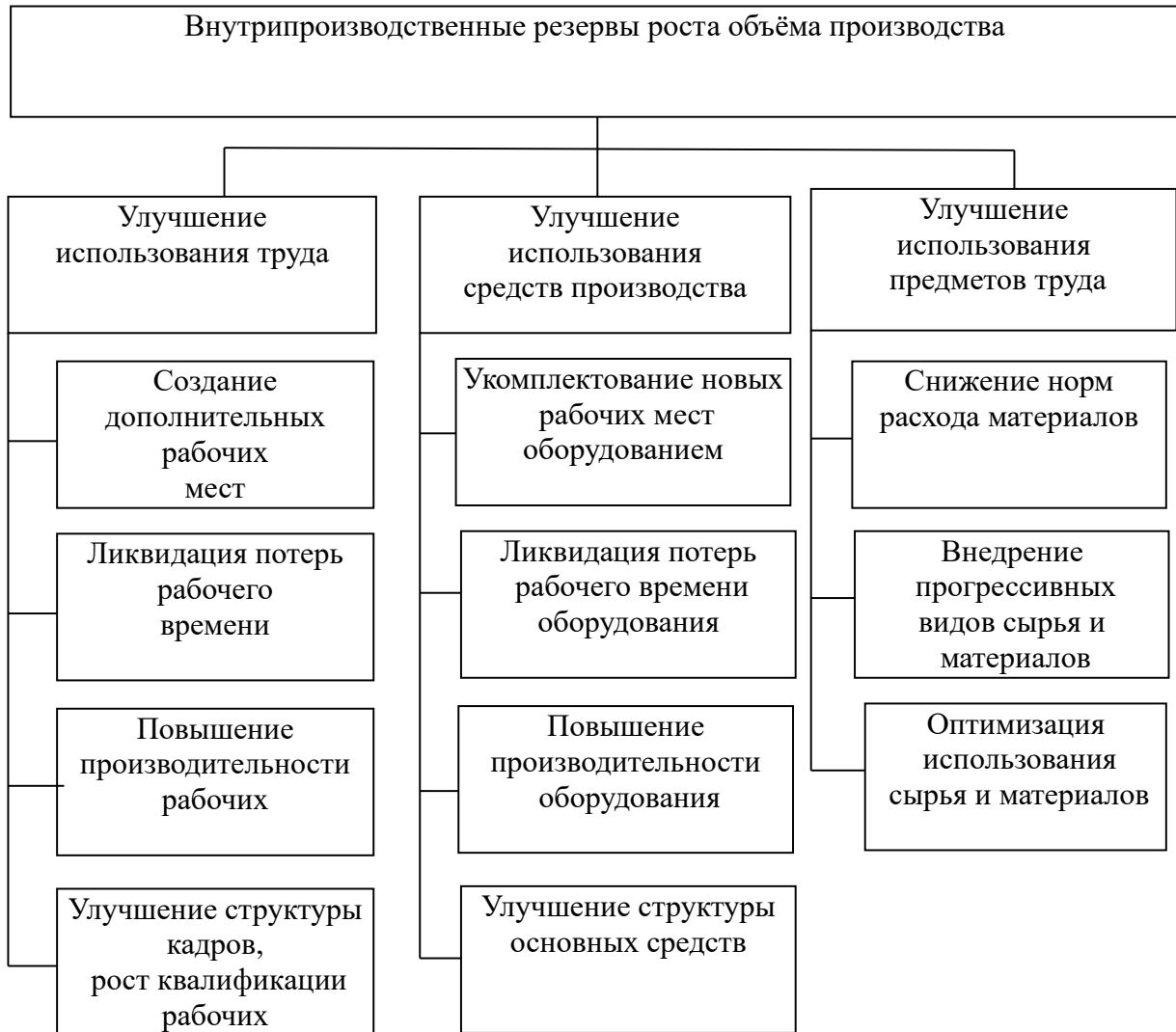
Рис. 4. Классификация внутрипроизводственных резервов роста объёма производства